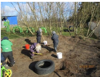
Der graves jord foråret 2021.

Vi har i Tangsø Børnehus arbejdet med krop, sanser og bevægelse på mange forskellige måder. Har fx benyttet hallen og svømmehallen. Vi har brugt naturen omkring os til udflugter. Ikke mindst har vi brugt vores kræfter ude på legepladsen med fx at grave tung jord til vores forspirede planter.