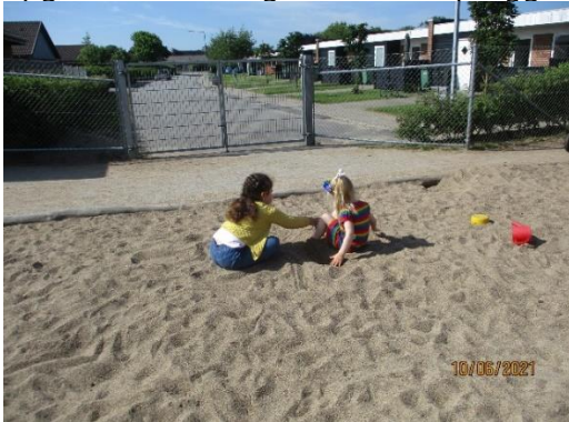
Her er to børn i gang med at kommunikere.

Vi har her i Tangsø Børnehus arbejdet med vores lokale læreplan på den måde, at vi har tænkt de seks læreplanstemaer ind i vores forskellige aktivitetsplaner. Derudover har vi i løbet af årene haft forskellige tema dage/uger. Vi har blandt andet arbejdet med sprog på den måde at der er blevet arbejdet med temaet eventyr, hvor der blev læst, lavet dialogisk læsning, sprogpøser og bordteater. Vi har i en periode haft en sproggruppe med de børn, som har udtale problemer, var sammen med en voksen i huset og øvede forskellige sprog opgaver. Vi har også haft en sproggruppe med de tosprogede, hvor de lærte mere ordforråd.