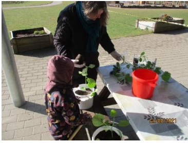
Planterne er klar til at komme i spand jord.