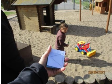
Der findes former og farver på legepladsen.