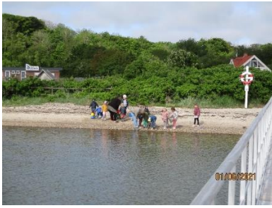
Her er der social fællesskab på stranden.

Vi har i Tangsø Børnehus arbejdet med Kultur, æstetik og fællesskab i det omfang det har været muligt. Vi har bibeholdt nogle af de traditioner, som vi normalt har. Men grundet Corona har meget været anderledes. Vi sørger for at børnenes ting kommer op at hænge et stykke tid inden de får det med hjem. Der har været udstilling med robotter, som børnene har lavet af genbrugsmaterialer.