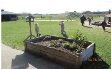
Der leges fangeleg på legepladsen.

Vi vil lave forskellige observationer i hallen, inde og på legepladsen. Vi vil kigge efter om børnene deltager, og om det er med et smil på læben. Vi vil se om børnene efterfølgende selv vil lege de forskellige lege vi sætter i gang. Vi vil via gentagelser lave de samme lege, hvor vi vil ændre på legene hermed gøre dem sværere. Vi vil forsøge at være opmærksomme på at alle børn deltager. Vi vil selv være aktive deltagere i de forskellige lege.