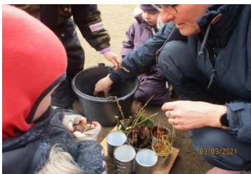
Her laves der et insekthotel til legepladsen.

Vi har her i Tangsø Børnehus arbejdet med natur, udeliv og science på den måde, at vi fx har gået ture i nærmiljøet. Vi har i foråret forspiret planter, som børnene har været med til at plante ud. Vi arbejder med former, farver og figurer, hvor børnene selv har fundet figurer rundt omkring i huset. Vi har fundet rigtig mange dyr på legepladsen, som er blevet nærstuderet af både børn og voksne.