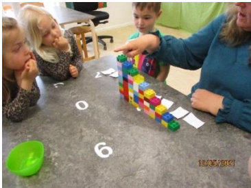
Vi arbejder med tal og mængder.

Vi har i Tangsø Børnehus arbejdet med krop, sanser og bevægelse på mange forskellige måder. Har fx benyttet hallen og svømmehallen. Vi har brugt naturen omkring os til udflugter. Ikke mindst har vi brugt vores kræfter ude på legepladsen med fx at grave tung jord til vores forspirede planter.