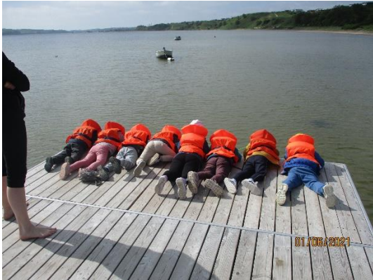
Vi fanger krabber sommeren 2021.

Vi har fx været ved vandet og fange krabber, som for nogen var meget grænseoverskridende. Det at turde røre ved en krabbe er for nogen grænseoverskridende. Men at indse, at den faktisk ikke er farlig, og at man faktisk godt turde røre dem, kan være med til at udvikle en. Det giver barnet en succesoplevelse man barnet kan vokse af.